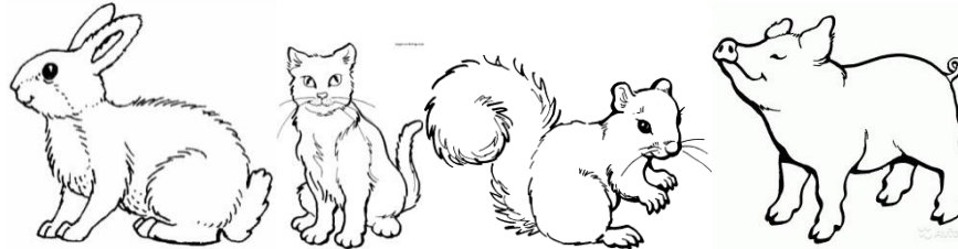
БЕЛКА СВИНЬЯ ЗАЯЦ КОШКА

4. По картинкам определи названия животных (укажи стрелками)